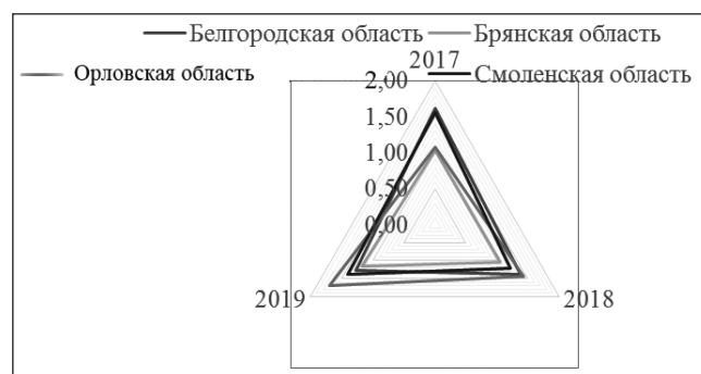
Рис. 2. Сравнительный анализ уровня финансовой безопасности регионов за 2017—2019 гг. (рассчитано авторами)

На основании проведенного анализа можно отметить, что наибольший уровень устойчивости и безопасности финансовой системы присущ Орловской области.