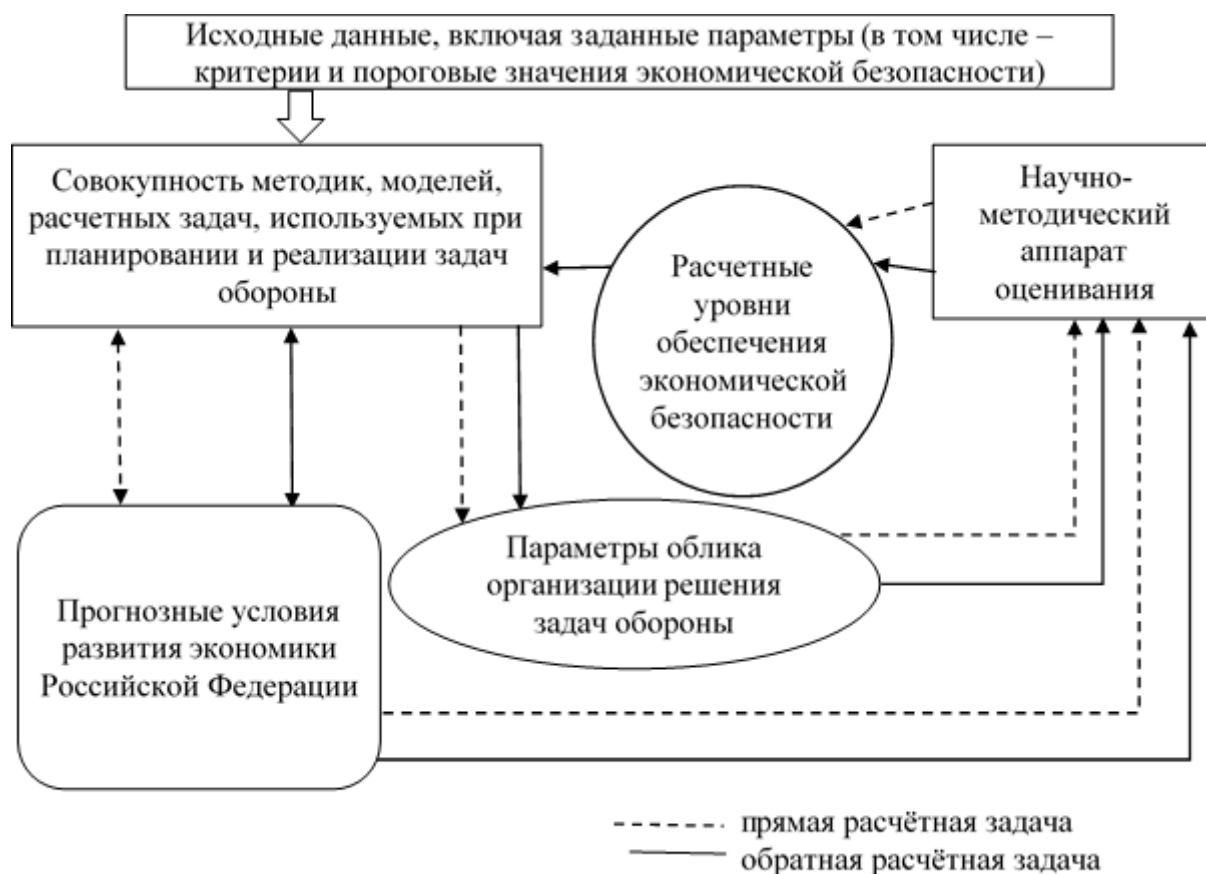
Рисунок 2. Укрупненный алгоритм применения научно-методического аппарата оценивания влияния угроз экономической безопасности на решение задач в области обеспечения обороны при решении «прямой» и «обратной» задач

оборонного планирования путем детализации соответствующих предметных областей. Наличие такого инструментария придает всей совокупности методик и моделей, используемых для оборонного планирования, новое качество, позволяющее решать, как «прямую», так и «обратную» расчетные задачи (рис. 2).